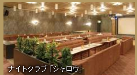
ナイトクラブ「シャロウ」